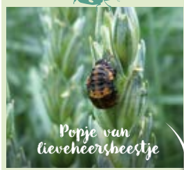
Popje van lieveheersheestje