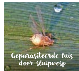
Geparasiteerde luis door sluipwesp