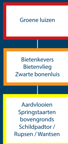
De focus van bestrijden van bovengrondse plagen moet liggen op groene luizen