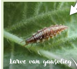
Larve van gaasvlie