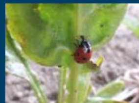
Lieveheersbeestje. Een belangrijke plaagbestrijder in de bieten.

Het risico op gewasschade verschilt per plaaginsect. Als een plaaginsect virussen op de plant kan overbrengen, is het risico op gewasschade groter dan wanneer dit niet het geval is. Het is daarom belangrijk om te weten wanneer er sprake is van mogelijke gewasschade door vraat of virusoverdracht. Bij dit laatste ligt de schadedrempel aanzienlijk lager. Het verschil is duidelijk te zien bij bladluizen. Groene luizen brengen een virus over omdat zij zich gemakkelijk binnen het perceel verplaatsen. De zwarte bonenluis doet dit niet of nauwelijks. Deze luis koloniseert zich sterk op één plant. De risico's op gewasschade van de verschillende plaaginsecten zijn hiernaast schematisch weergegeven.