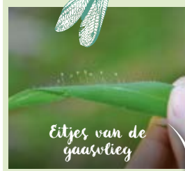
Eitjes van de gaasvlie