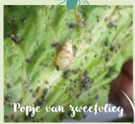
Popje van zweefvlieg