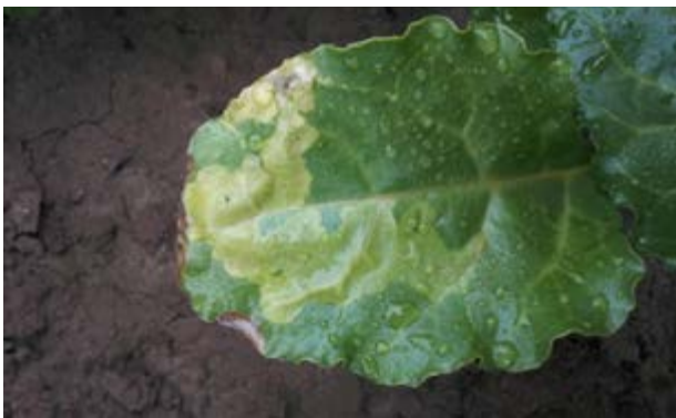
Schadebeeld bietenvlieg

Planten die door plaaginsecten worden aangeprikt, scheiden geurstoffen uit. Hierdoor worden natuurlijke plaagbestrijders gelokt, zoals kevers en lieveheersbeestjes. Zij doen zich te goed aan de plaaginsecten. in de tabel hiernaast een overzicht van plaaginsecten en hun plaagbestrijders.