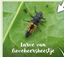
Larve van lieveheersheestje