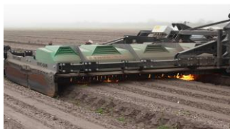
Garford, Ferrari Remoweed, Poulsen Robovator, Steketee IC weeder